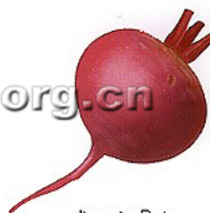
die rote Bete